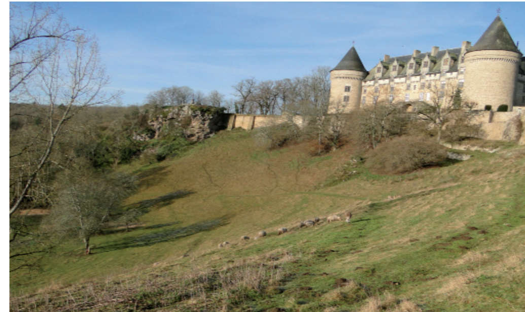
Le château dominant le cratère forgé par la Météorite