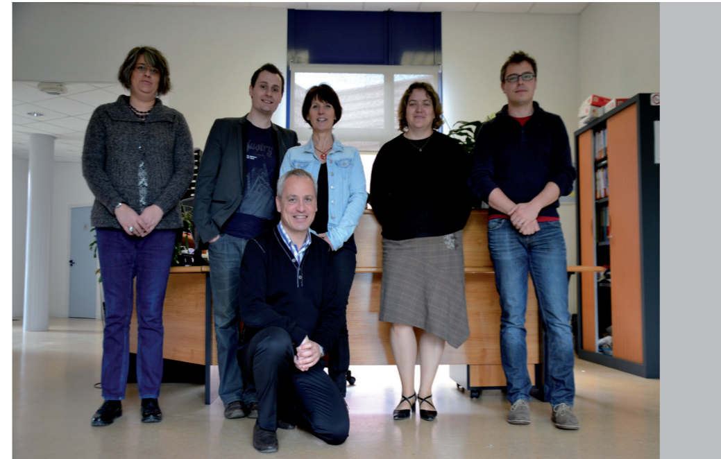
L'équipe de POL Avenir et de jeunes pousses de la Pépinière

Evidemment, la création de 60 emplois à minima et la réhabilitation des bords de Vienne bénéficieront directement à la population. Des retombées importantes sont attendues au niveau touristique, avec des chiffres estimés aujourd'hui à 30 000 visiteurs par an. Avec le village martyr et le Centre de la Mémoire à Oradour-sur-Glane, et Cassinomagus à Chassenon, on peut faire en sorte que les touristes parcourent tout un circuit sur le territoire, et ainsi garantir leur consommation sur place.