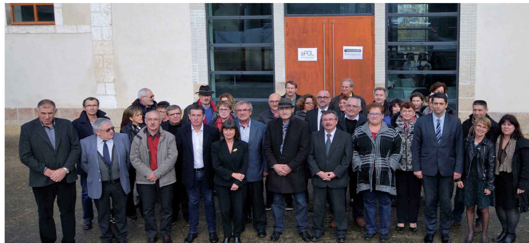
9 janvier 2016 Installation du nouveau Conseil communautaire

* Retrouvez l'intégralité des statuts sur le site internet porteoceane-dulimousin.fr