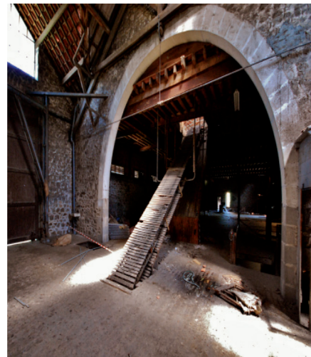
La Cité du cuir de Saint-Junien : un patrimoine industriel exceptionnel