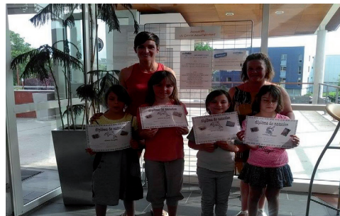
Fières de leurs diplômes de natation, et elles ont bien raison