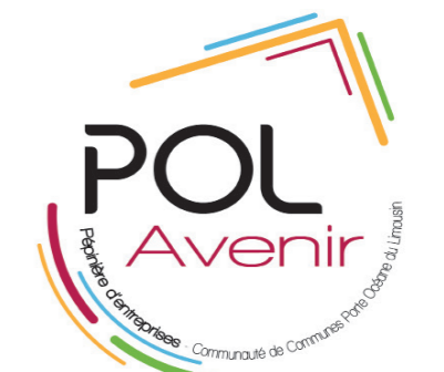
Nouveau départ, nouveau logo

solidarité entre les entreprises hébergées. Aujourd'hui, les services de Pol Avenir me sont indispensables.