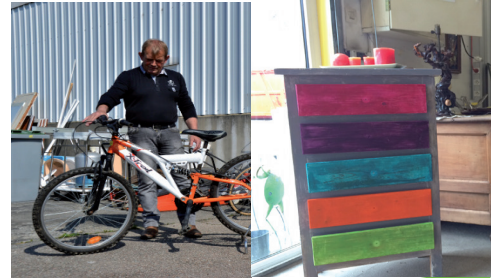
Vélos comme neufs ou des armoires relookées... on trouve tout et pas cher à la Ressource Rit

Depuis le mois de septembre, la ressourcerie complète les nombreux projets déjà en marche de l'association ALEAS et ses partenaires. Bien installée sur le territoire, elle est à l'origine de Lysa, Mille Pages, la Troc et du chantier d'insertion de l'île de Chaillac.