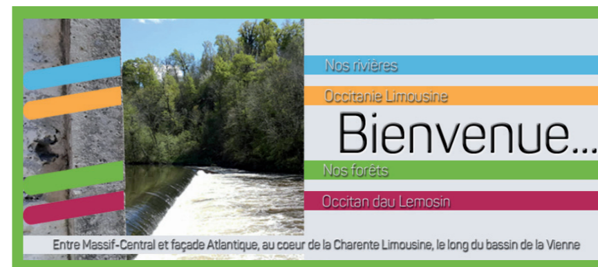
Couverture de la page Facebook de la POL